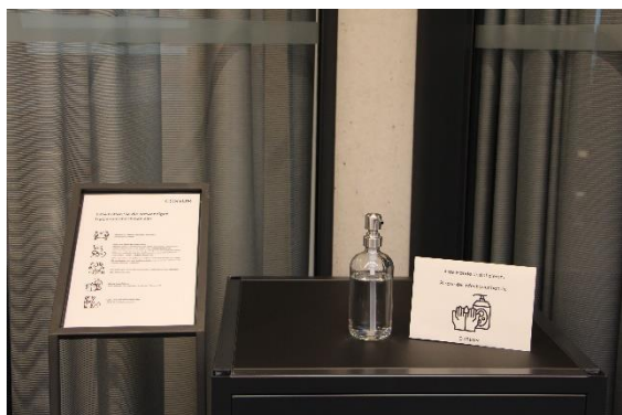
Hinweisschilder und Desinfektionsmittelpendern stehen vor jedem Tagungs- und Seminarraum sowie den Toiletten.