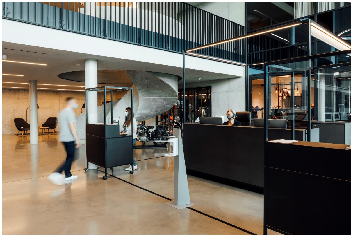
Unser Empfangsbereich mit Abstandmarkern, Desinfektionsmittelpendern an verschiedenen Stellen, mobiler Empfangstheke mit Schutzscheibe sowie kostenlosen Einwegmasken.