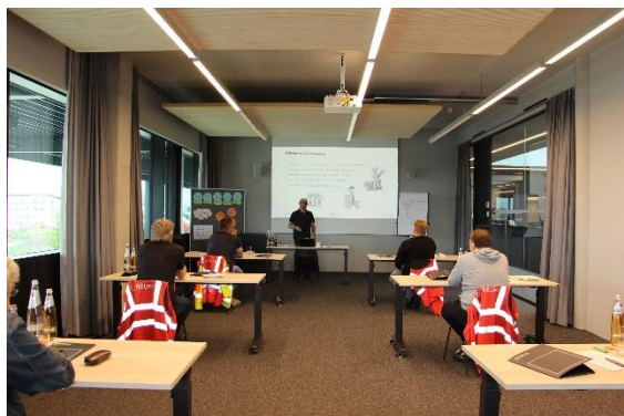
Tagungsraum 4 mit Parlamentsbestuhlung